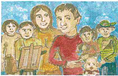
Gmina Kłobuck dla rodziny - Karta Dużej Rodziny