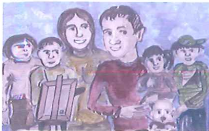
Gmina Kłobuck dla rodziny - Karta Dużej Rodziny