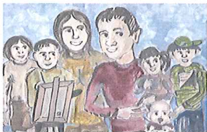
Gmina Kłobuck dla rodziny - Karta Dużej Rodziny